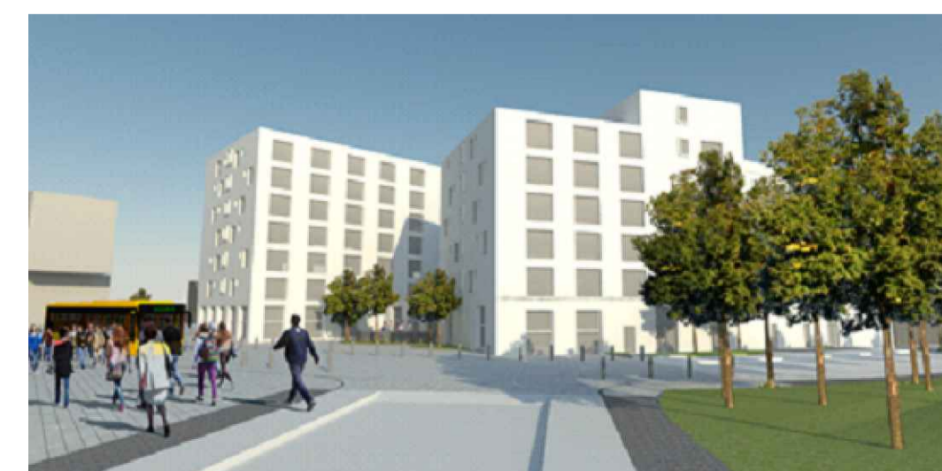
Visualisering från nordväst (Sydark arkitekter). Bilden redovisar den föreslagna nya bebyggelsen, entréplatsen och omgestaltningen av del av Ole Römers väg.