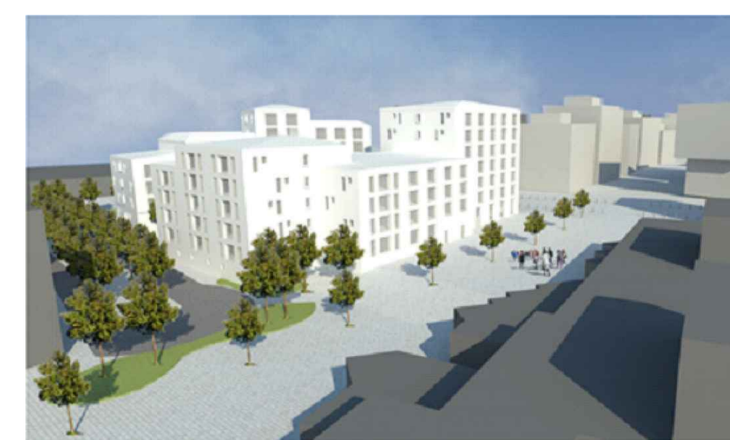
Visualisering från sydöst (Sydark arkitekter). Bilden redovisar den föreslagna nya bebyggelsen och befintligt gång- och cykelstråk.