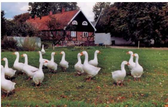
Gäss i Stångby kyrkby.

Här finns också flera fornsar och fall som sedan 1600-talet har använts för kvarnverksamhet. Under vår tur passerar vi Krutmöllan – Hoby mölla (inte att förväxla med benmjölsfabriken) som är en 300-årig anläggning med hus i korsvirke och tegel. Här