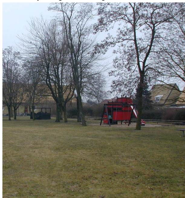
Park vid Kyrkvägen - Åkervägen

Revinge bypark ligger i byns östra del söder om kyrkan. Parken ligger i direkt anslutning till skolan och har två entréer gemensamt mellan skolgård och park. Parken karaktäriseras till största delen av en bollplan som omgärdas av ett trästaket. Växtmaterialet är relativt begränsat i sin omfattning och består av ett fåtal oxlar och björkar. Söder om bollplanen ligger parkens lekplats som avgränsas med ett buskparti. Rumsbildningen i lekplatsens olika delar definieras likaså av buskar. Parken ligger i nära anslutning till bostadsområdena väster och söder om parken och knyts samman av en grusgång som löper genom parkens västra del. Stigar inne i de upp vuxna syrenbuskarna som delar av parken avslöjar att de fungerar för lek. Parken skulle kunna göras mer spännande genom en översyn av växtmaterialet.