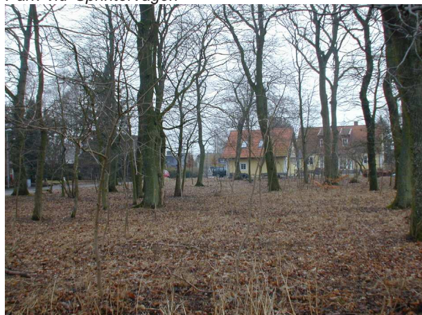
Park vid Sprintervägen