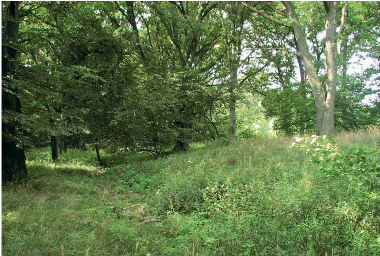
Frodiga lövskogar vid Häckebergasjön.

I backlandskapet beskrivs följande trakter: 5.1 Toppeladugård, 5.2 Lyngby - Hässleberga, 5.3 Assartorp - Bökesåkra, 5.4 Risen - Gräntinge, 5.5 Häckeberga, nordväst, 5.6 Häckeberga, nordöst, 5.7 Häckeberga, sydväst, 5.8 Häckeberga, sydöst och 5.9 Björkesåkra