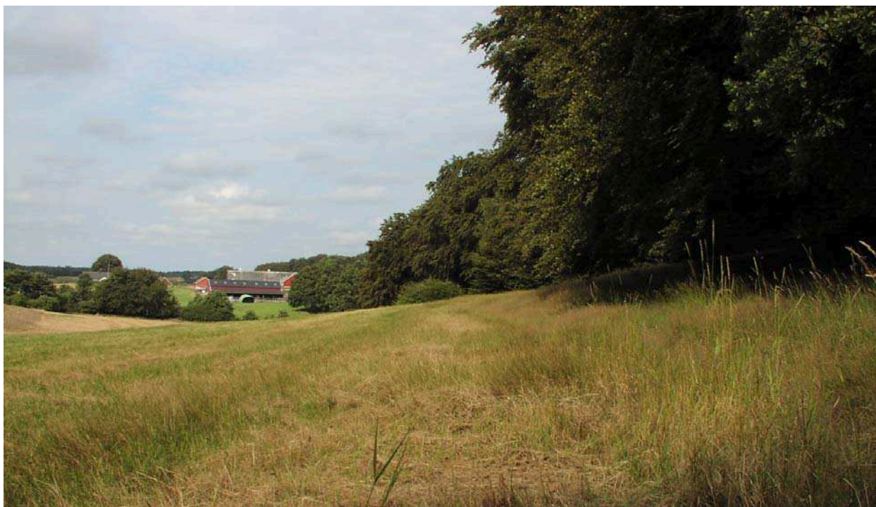
Böljande landskap i södra delen av Häckeberga naturvårdsområde