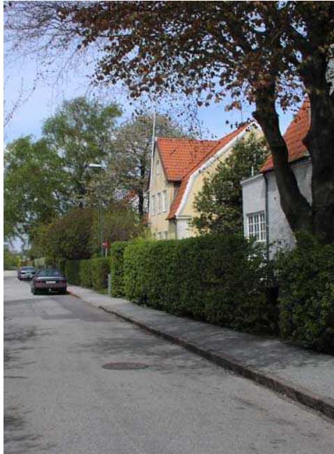
Trädgårdarna ingår i bebyggelsemiljöns kulturhistoriska värde (Karlavägen i Lund).