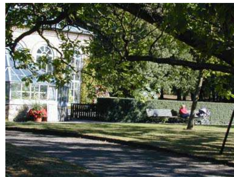
Botaniska trädgården har såväl sociala och kulturhistoriska som ekologiska värden.