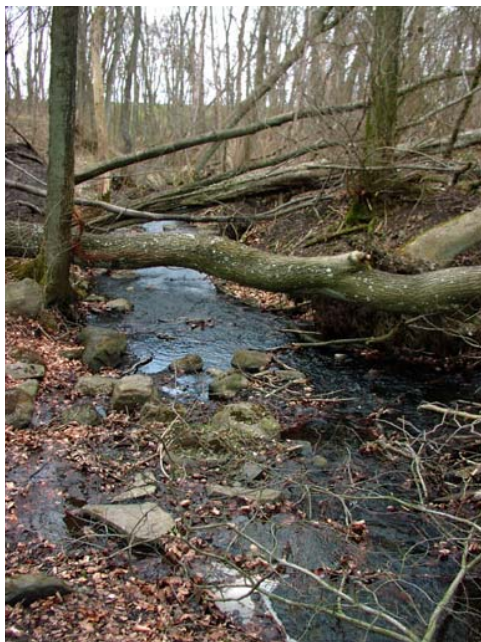
Fågelsångsdalen är skyddad som naturreservat sedan 1963.