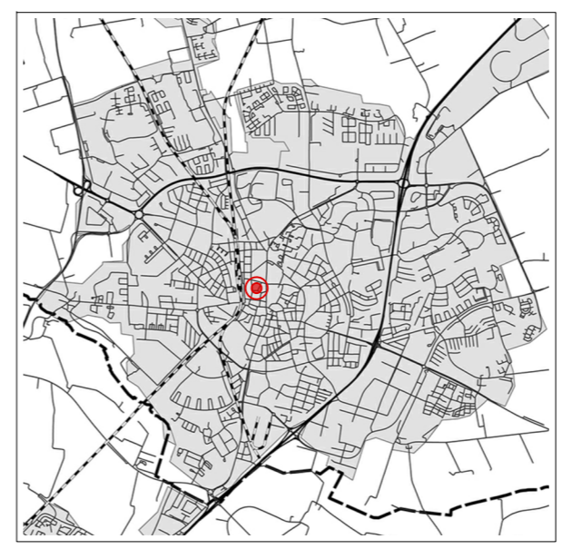
Orienteringskarta över Lund