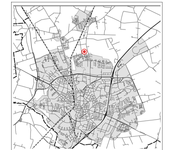
Orienteringskarta över Lund