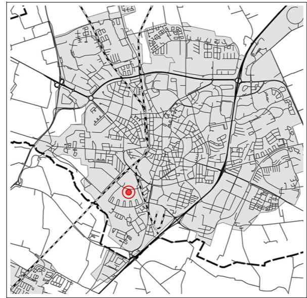
Orienteringskarta över Lund

GRUNDKARTAN UPPRÄTTAD 2024-01-12 Fastighetsredovisningen aktuell 2024-01-12 Koordinatsystem: Sveref 99 13 30 Höjdsystem: RH 2000 GRUNDKARTEBETECKNINGAR --- områdesgräns --- kvartersgräns --- fastighetsgräns med gränspunkt KLOSTERGÅRDEN 3:1 traktamn med register-nummer för fastighet MOLNET 3 kvartersnamn med register-nummer för fastighet --- traktgräns --- traktgräns ga:3 registrerad gemensamhetsanläggning s:1 registrerad samfällighet serv: servlut --- samma fastighet på ömse sidor om linjen --- byggnad karterad efter huslvet --- byggnad karterad efter takkanten --- skärmtak resp trappa --- transformatorbyggnad --- stödmur --- häck resp mur --- staket med grind --- väg, gångväg --- kantsten med rännstensbrunn --- slänt --- belysningsstolpe resp brunn --- träd