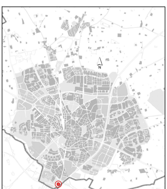
Orienteringskarta över Lund