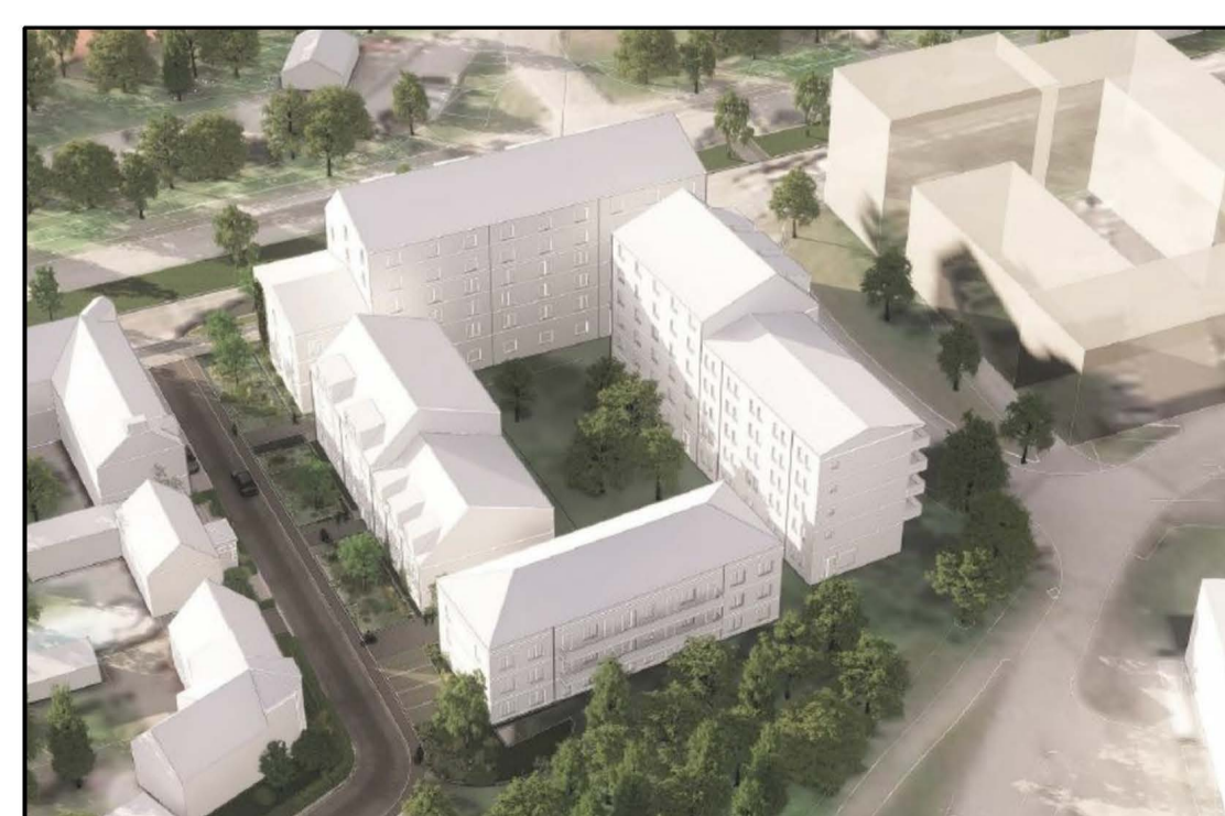
Illustrationerna visar de föreslagna nya byggnadsvolymer i kvarteret

Genomförandetiden är 10 år från den dag detaljplanen har vunnit laga kraft