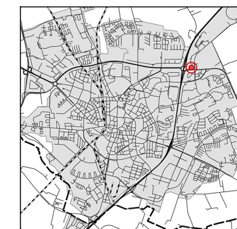
Orienteringskarta över Lund

Dimensionerande flöde av dagvatten till allmän ledning får ej överstiga 20 l/s/ha vid ett 10-års regn.