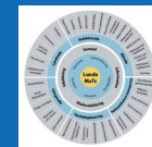
LUNDA-MaTs II 2006