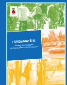
LUNDA-MaTs III 2014