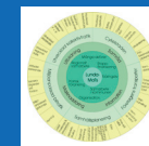
LUNDA-MaTs I 1999