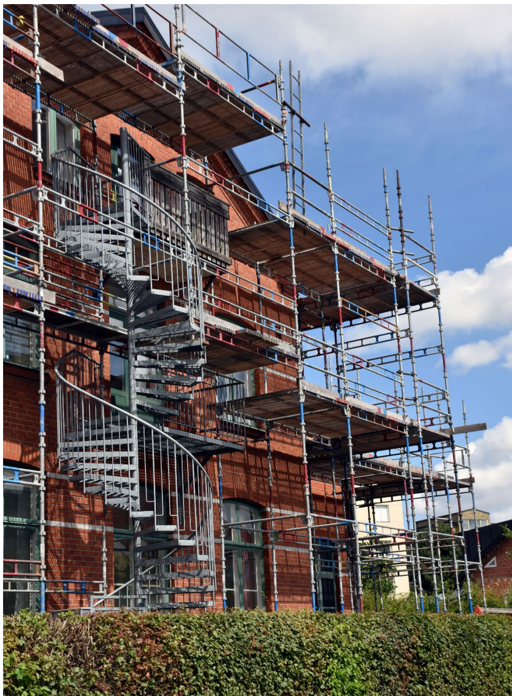
Renovering av skolbyggnad.

Översiktsplanen lyfter behovet av att minska utsläpp från byggande och anläggning. Lund växer fort, och har därmed ett särskilt ansvar att minska utsläpp från kommunens tillväxt. Fyrstegsprincipen som föreslås ska vara vägledande, vilket är positivt. Att planera för flexibla byggnader och att kunna ändra funktion minskar behovet av att riva och bygga nytt framöver. Ett exempel där strategin kan få genomslag är att stora skoltomter, med möjlighet att ta emot fler elever, reserveras. Det ger möjlighet att bygga till och på skolbyggnader utan att kommunens riktlinjer för skolgårdar frångås.