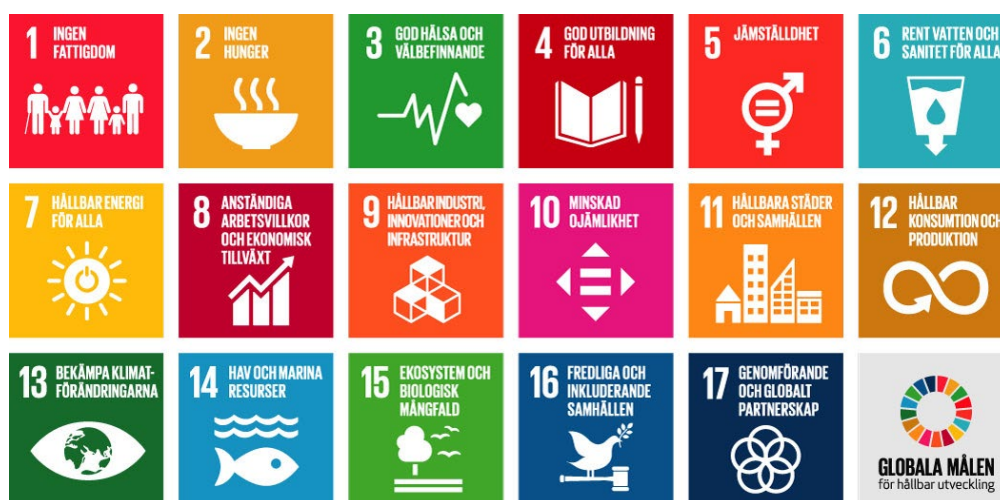
De 17 globala målen.

Den översiktliga planeringen lägger grunden för fysiska strukturer som direkt påverkar måluppfyllnad av särskilt mål 11 – Hållbara städer- samt mål 7, 9, 13 och 15. De fysiska strukturerna påverkar exempelvis även mål 3 – Hälsa och välbefinnande och mål 5 om jämställdhet men också förutsättningarna att få rent vatten och möjlighet till arbete.