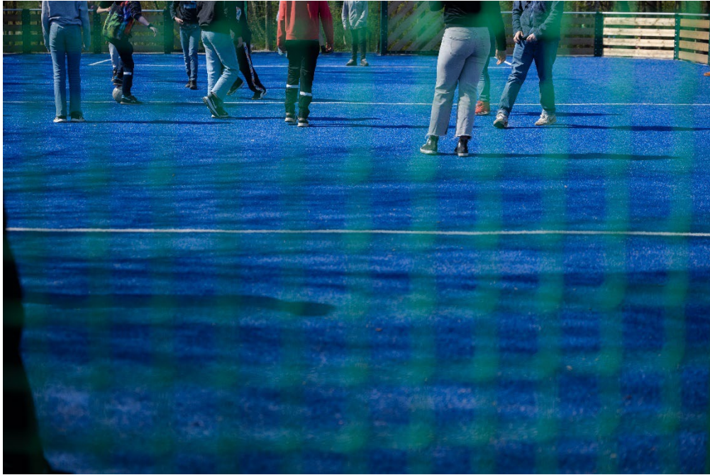
Lek på Mårtenskolans skolgård.

utbyggnad har beräkningar av befolkningsförändring gjorts med hjälp av kommunens verktyg för nybyggnadsprognoser. Prognosen har förutsatt en jämn utbyggnadstakt och ett antagande om fördelning av bostadstyp efter respektive ords specifika förutsättningar. En annan takt, fördelning eller annan utbyggnadsvolym ger andra behov av investeringar. I bedömningen av behov har planerad kapacitet som anges i den gällande strategiska lokalförsörjningsplanen tagits med, även kapacitet som planeras efter aktuell planperiod.