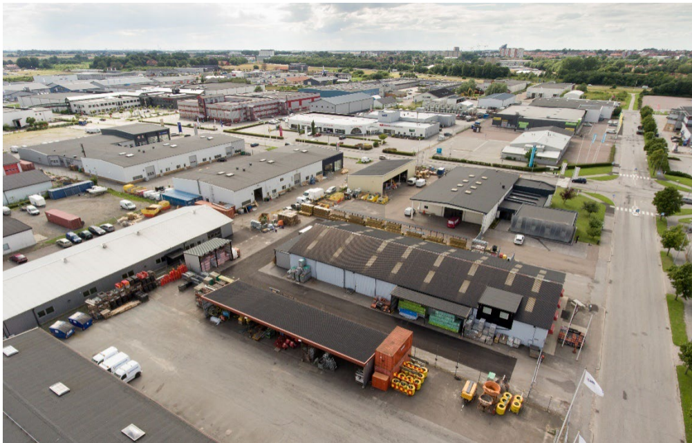
Verksamhetsområde i Lund.

Aktiva och strategiska markinköp och en nära dialog med näringslivet är viktiga framgångsfaktorer. Samverkan med näringslivet i olika former, särskilt kopplat till forskning och utbildning, kan bidra till mervärden och till att driva nya hållbara lösningar i stadsbyggandet.