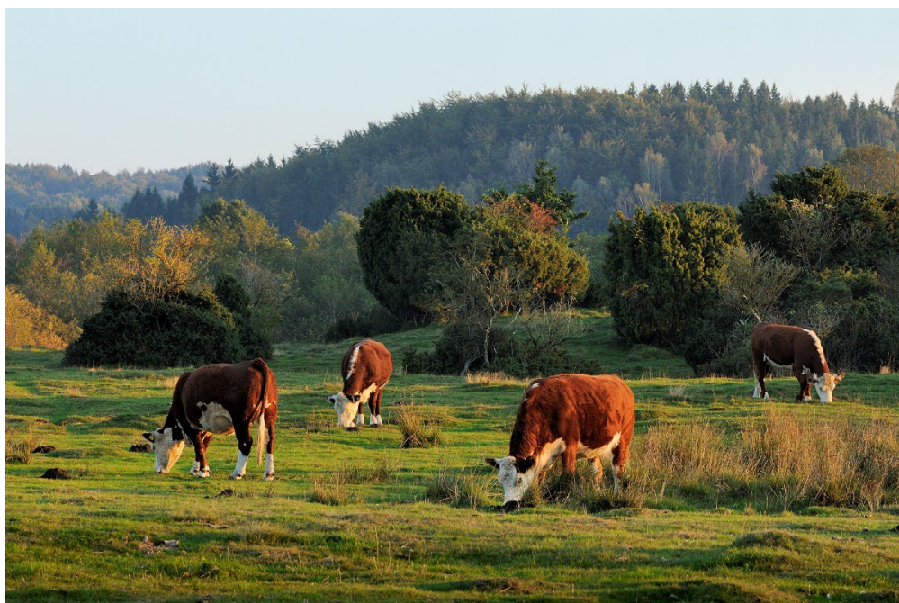
Risen naturreservat utanför Genarp.

I en tät struktur finns sämre förutsättningar i staden och tätorterna för att upprätthålla en funktionell grön infrastruktur med biologisk mångfald och andra ekosystemtjänster som vi är beroende av. Allt fler behov ska lösas på en mindre yta och med konkurrens om marken finns det risk att värdefull grönstruktur tas i anspråk för bebyggelse. Det blir därför viktigt att i efterföljande planering ta ett strategiskt helhetsgrepp kring grönstrukturen, framför allt i Lunds stad, för att utreda var det är lämpligt/olämpligt och hur sådana förändringar påverkar hela stadens gröna infrastruktur. Samtidigt föreslås få utbyggnadsområden på naturmark vilket är positivt för kommunens storskaliga gröna infrastruktur. Dock räcker det inte att områden lämnas oexploaterade för att den biologiska mångfalden ska utvecklas, utan här krävs ytterligare insatser.