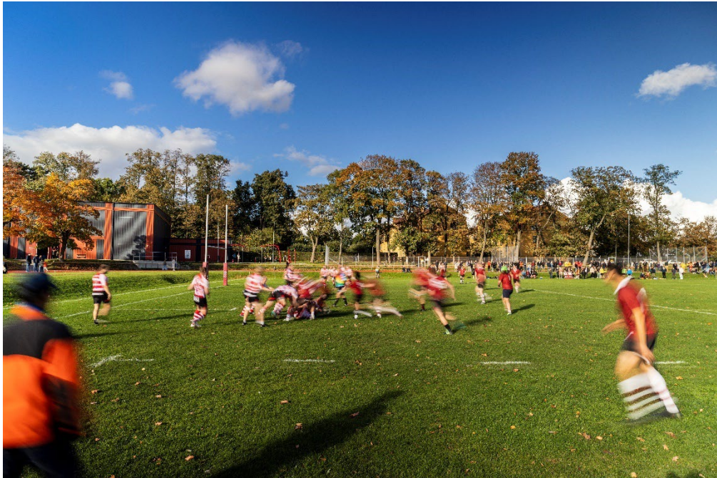
Centrala idrottsplatsen i Lund.

Ett förvaltningsövergripande arbete som syftar till att ta fram en helhetsbild för idrotten i kommunen pågår. Parallellt utreds framtida lokalisering för universitetssjukhuset. Med anledning av detta innehåller samrådsförslaget ingen slutlig markanvändning för idrottens behov. En tydligare bild bör inarbetas inför granskning av översiktsplanen.