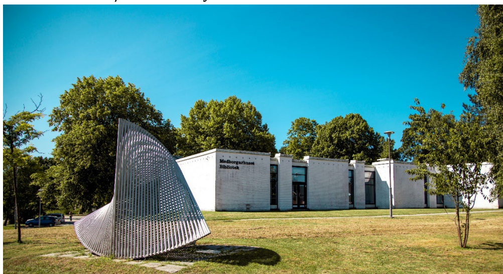
Medborgarhuset i Genarp.

Generellt är tillgången till service god i alternativet. Däremot finns en risk för att ytkrävande service- och fritidsfunktioner inte får plats i staden/tätorterna och hamnar i dess ytterområden, med längre avstånd och lägre tillgänglighet som följd. Detta är särskilt negativt ur ett barnperspektiv. Även kulturverksamhet som är mer störande riskerar att hamna i stadens/tätorternas ytterområden.