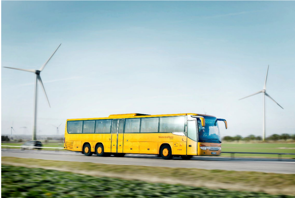
Kollektivtrafiken är en viktig del i den hållbara mobiliteten.

Jämlig fördelning av resurser inkluderar även tillgång till rekreation och friluftsliv. Planen föreslår att alla ska ha tillgång till minst 1 ha park inom 300 meter, vilket är positivt liksom att allmänt öka träd och grönska i staden. Det skapar fler gröna miljöer att vistas och röra sig i. Att stärka tillgången utanför orterna, särskilt där det saknas natur, och arbeta för att tillgängliggöra landskapet för rekreation bidrar till att fler kan få rekreativa upplevelser utan att ta sig med bil. Att förbättra tillgången till naturområden i östra kommundelarna via kollektivtrafik är vidare en positiv inriktning, som också möjliggör för hela regionens befolkning att vistas i Lunds natur.