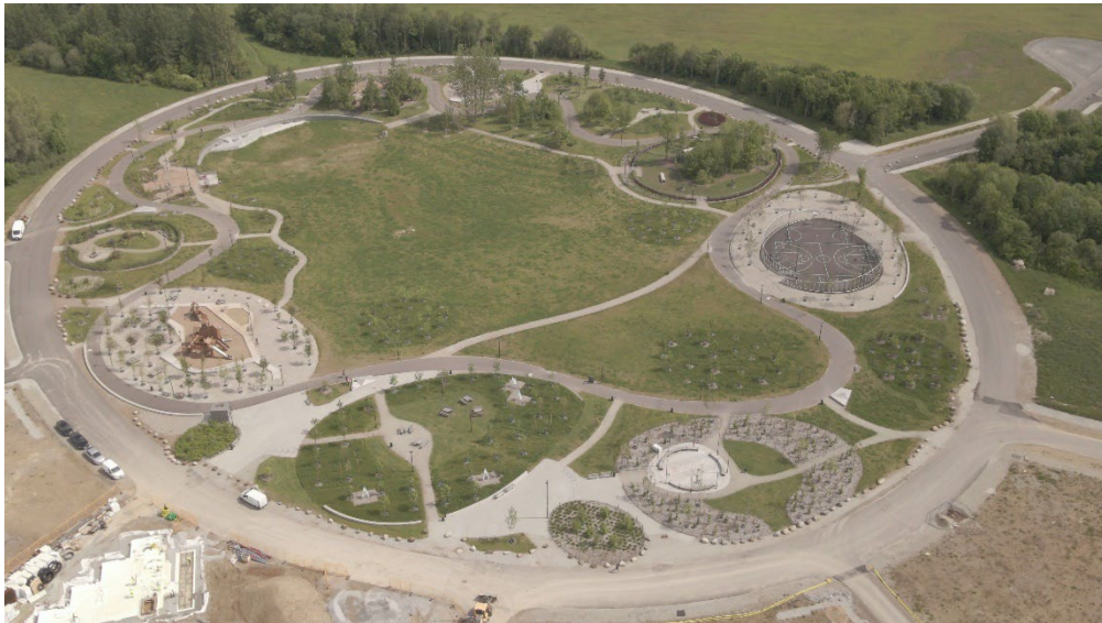
Nobelparken i Brunnsög.

En stor andel av tillväxten ska ske genom förtätning vilket innebär fler och mindre exploateringsprojekt. Detta ger ett mer komplicerat genomförande med fler osäkerheter. En kraftigare utbyggnad på jordbruksmark som redan är i kommunens ägo hade gett ett mindre komplicerat genomförande och bättre förutsättningar för en positiv exploateringsökonomi. Det hade dock varit i konflikt med andra kommunala mål.