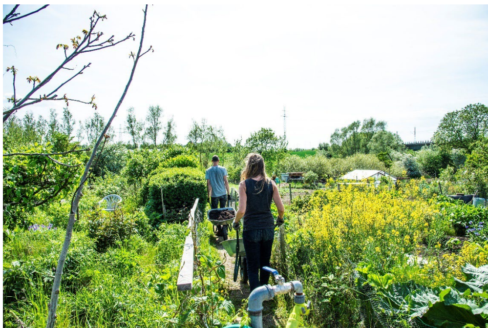
Odlingsområde i Lund.

Översiktsplanen innebär att områden för rekreation och fritid kan komma att tas i anspråk för ny bebyggelse, vilket kan medföra en försämrad tillgång till rekreation. Detta gäller inte bara parkmark utan även fotbollsplaner och odlingslotter som spelar en stor roll för människors välbefinnande. Även exploatering av mindre grönytor kan medföra att lokala värden går förlorade eller att kopplingar mellan olika grönområden försvagas. Samtidigt innebär en ökad befolkning att trycket på befintlig grönstruktur och fritidsanläggningar blir ännu större.