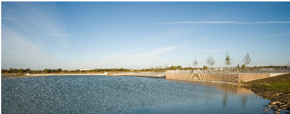
Råbysjön, en dagvattenanläggning i Råbylund.

Vatten är en grundförutsättning för allt liv på jorden och tillgången på rent vatten är avgörande för en långsiktigt hållbar utveckling. Översiktsplanen lyfter flera olika vattenaspekter – att uppnå miljö kvalitetsnormer, säkerställa dricksvattenförsörjning, hantera olika typer av översvämningar liksom torka. Att ge vattnet en tydlig plats i strategier och karta är positivt. Utöver det som syns i kartan kommer ytor för rening, fördröjning och skyfallshantering behövas i båda förtättnings- och utbyggnadsområden. Genomförande av vattenstrategierna kommer kräva ekonomiska resurser och en strategisk planering som sker över detaljplanegränser och involverar flera aktörer. Plats för olika vattenrelaterade behov behöver säkerställas.