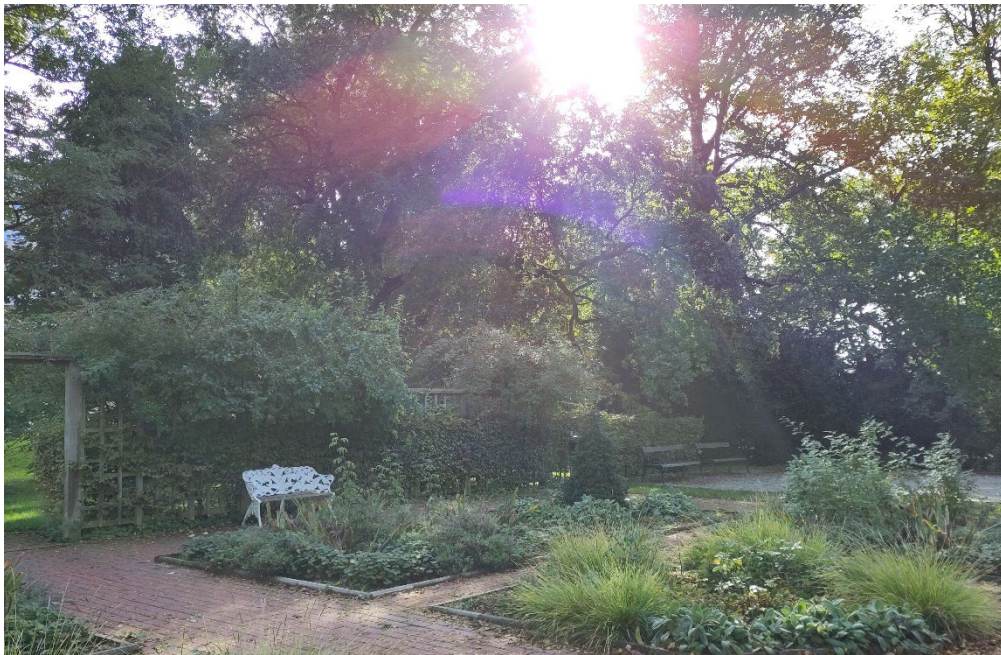
Tunaparken i Lund.

I ett förändrat klimat kommer problem med såväl översvämningar, torka som värmeböljor att öka. I planen föreslås att andelen träd och korn-täckning i bebyggda områden ska öka. En ökad grönska kan bidra till att sänka höga temperaturer vid värmebölja och hantera vatten vid skyfall och översvämningar. En ökad hårdgöring av grönytor innebär tvärtom en ökad risk för negativa hälsoeffekter och ekonomiska konsekvenser. I landskapet föreslås fördröjning av vatten i syfte att rena, minska översvämningar och om möjligt skapa redundans vid torka för både ekosystem och lantbruk. Genom restriktioner för ny bebyggelse avseende översvämning undviker vi att bygga i utsatta områden i framtiden.